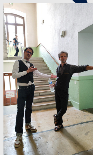
Nos participant·e·s ont été bien accueillis au KDS 4 !