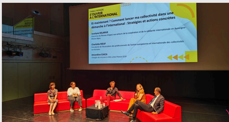
Table ronde "S'ouvrir à l'international"

L'ARRICOD a eu l'honneur de participer à une table ronde organisée par la Ville de Chambéry et le Département de la Savoie portant sur l'ouverture à l'international des collectivités territoriales. En présence de différents acteurs, nous avons échangé autour des bénéfices de l'action internationale , de la construction d'une citoyenneté ouverte mais aussi des stratégies et actions concrètes pour se lancer à l'international .