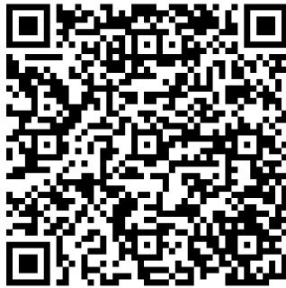
"LES CADEAUX PROTOCOLAIRES"